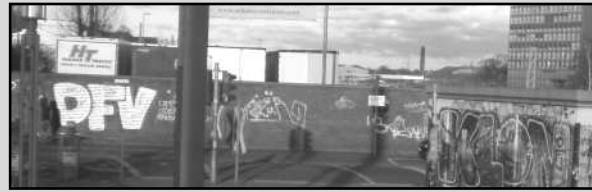
Keupstraße / Industriebrache