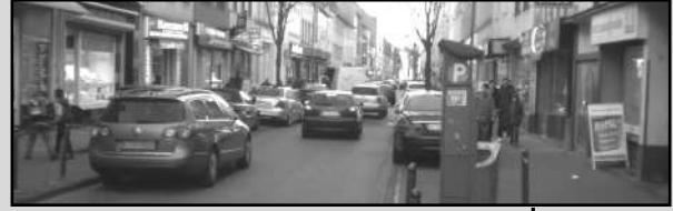
Keup Caddesi için Ayrılan »HIÇ«