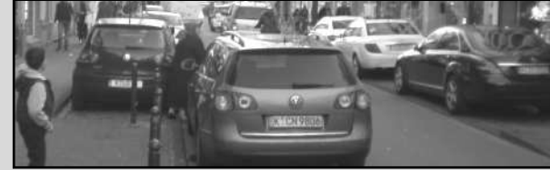
Keup Caddesi için »Park Yeri Sıkıntısı«