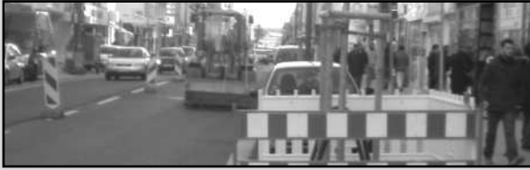
Frankfurter Caddesi için Milyonlar Hacanırken