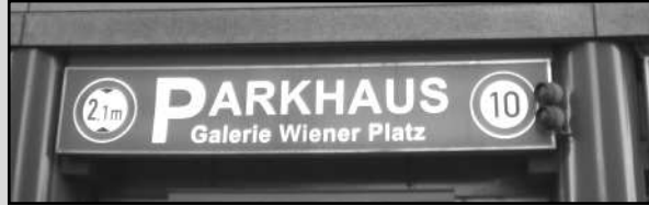
Frankfurter Caddesi için Kapalı Park Yerleri